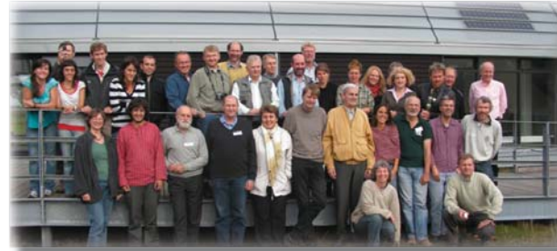
Участники INFORSE-Europe Семинара 2010, CAT, Wales, UK

International Network for Sustainable Energy