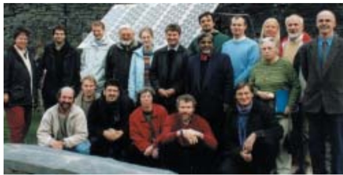
Los participantes en el seminario de INFORSE-Europe en CAT, Wales, 2003