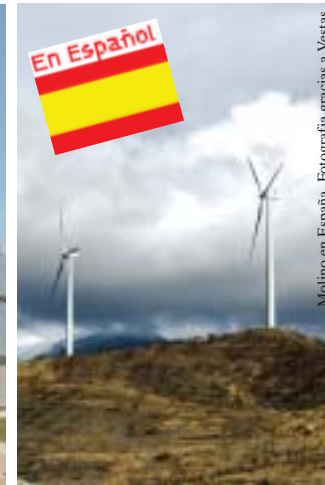
Molino en España.

INFORSE es una red de organizaciones independientes y no gubernamentales que trabaja en favor de las soluciones energéticas más sostenibles.