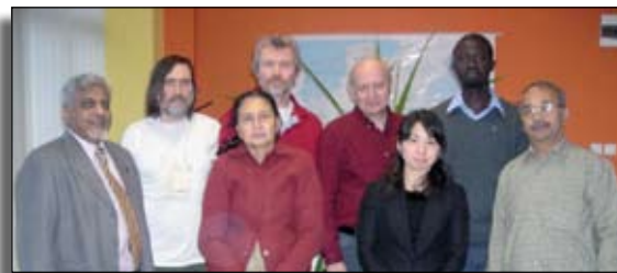
Les participants de la coordination INFORSE qui se rencontrèrent en décembre 2009 durant UNFCCC COP14, Poznan, Pologne.